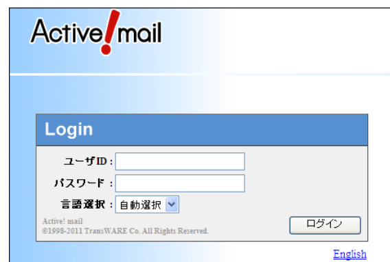
図2 Active!mail のログイン画面