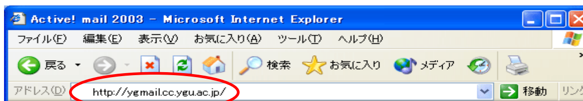
図1 Active!mail の起動